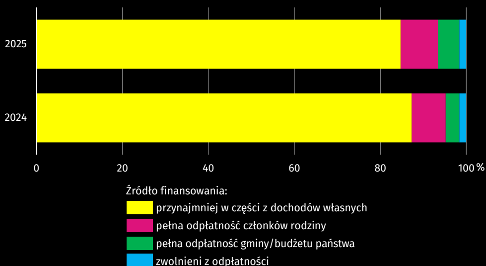
Wykres 3. Mieszkańcy zakładów stacjonarnych pomocy społecznej według źródła finansowania pobytu Stan w dniu 31 grudnia

W końcu 2025 r. w zakładach stacjonarnych pomocy społecznej pracowało 2617 osób, dla których było to główne miejsce pracy. Kadre pracowników stanowiło m.in.: 114 pielęgniarek oraz 66 fizjoterapeutów. Bezinteresowną pomoc w opiece nad osobami starszymi i z niepełnosprawnościami niósł 136 wolontariuszy.