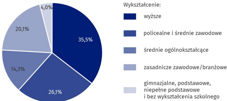
Wykres 1. Struktura ludności w wieku 15-89 lat aktywnej zawodowo według poziomu wykształcenia w 1 kwartale 2026 r.